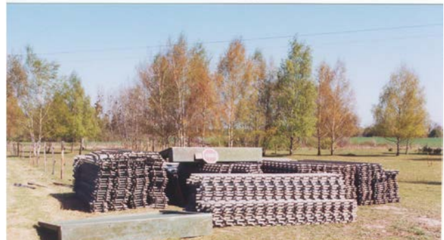
Un gros tas qu'il faudra installer sur ce terrain