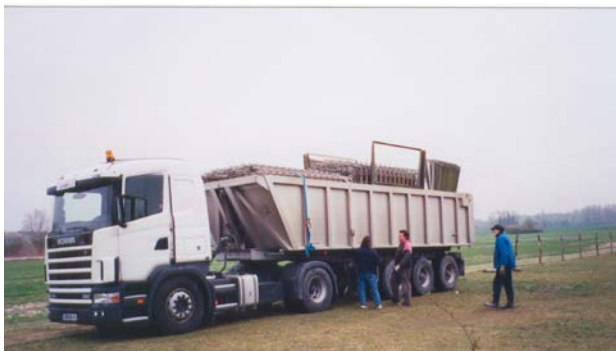
Livraison des rails et du tunnel démonté