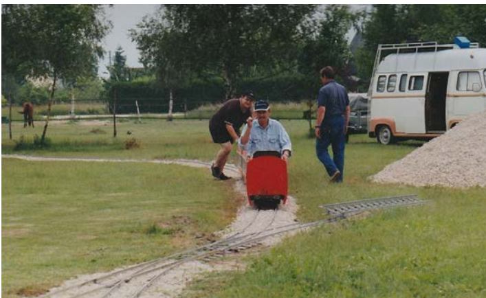
Juin 2003 - Travaux de pose de voies, réglages et essai avec une voiture du TGV