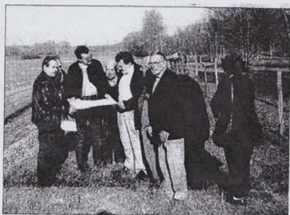
L'association « circuit vapeur Denis Papin » vient d'acquérir un terrain de 15 hectares, pour installer un circuit.

s associa- est un clin t, puisque rent en re- ntion de est baptis- eur Denis 3 février l'associa- Montils, et féminina- Petit train