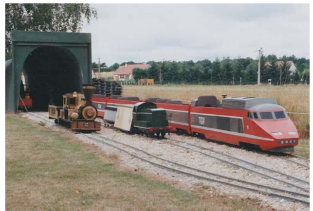
Juillet 2003 – Matériel prêt au départ pour essais en ligne